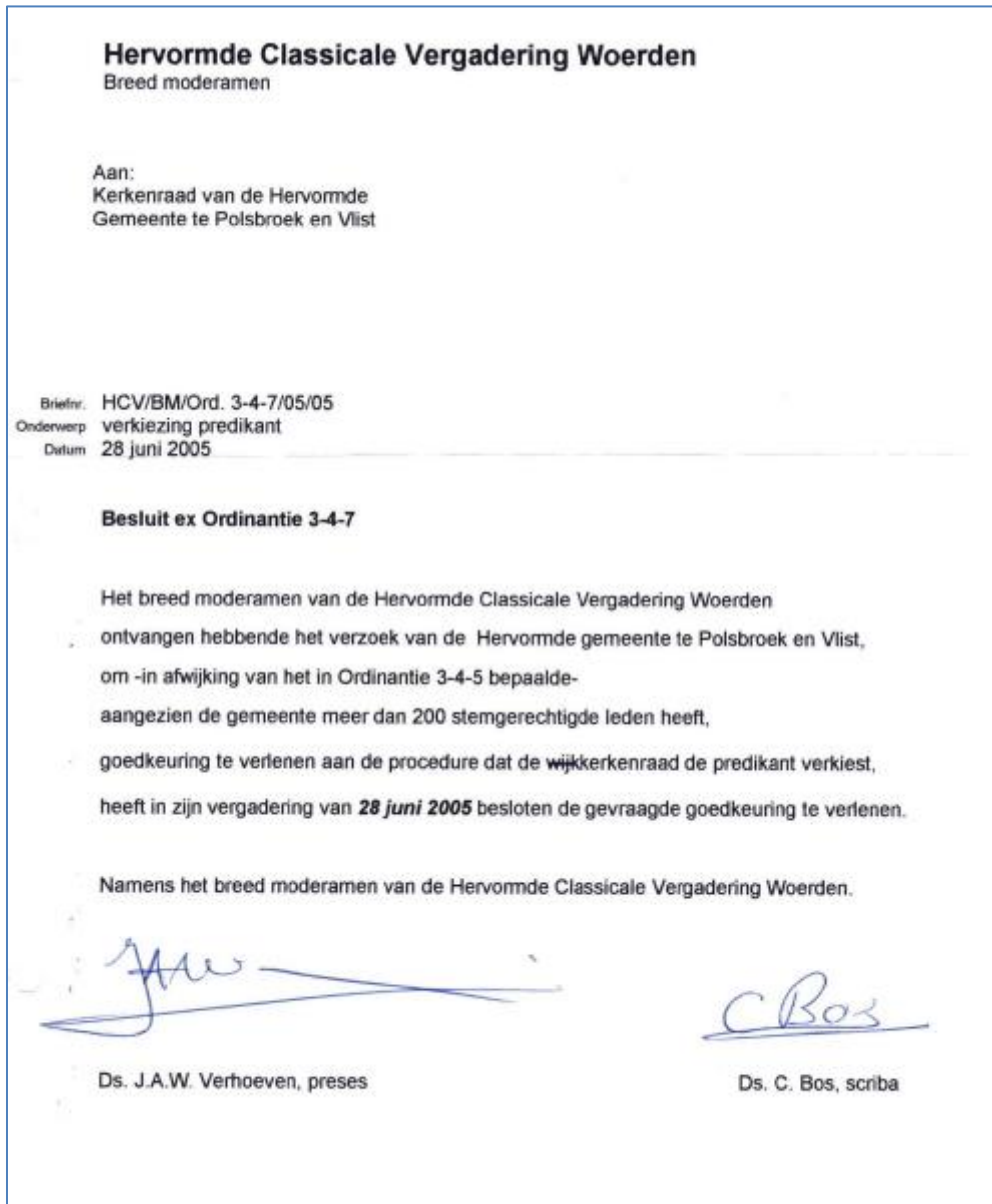
Figuur 1 - goedkeuring breed moderamen classis op grond van ordinantie 3-4-8 (voorheen 3-4-7)

In afwijking van het bepaalde in Ord. 3-4-6 worden predikanten verkozen door de kerkenraad.